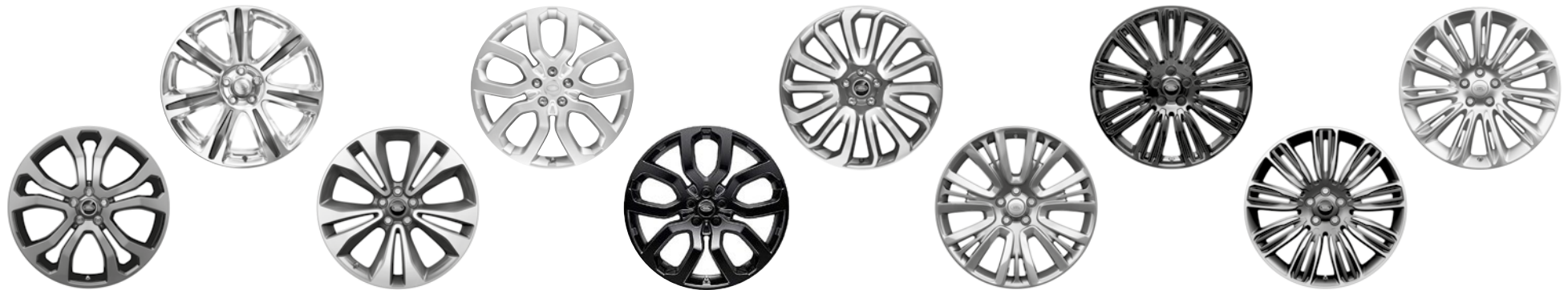
21" KOLA S 5 DVOJITÝMI PAPRSKY DARK GREY (STYLE 5005)