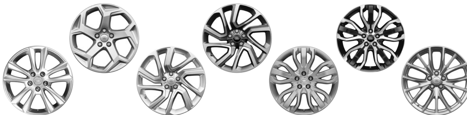
19" KOLA S 5 DVOJITÝMI PAPRSKY (STYLE 5001) 3