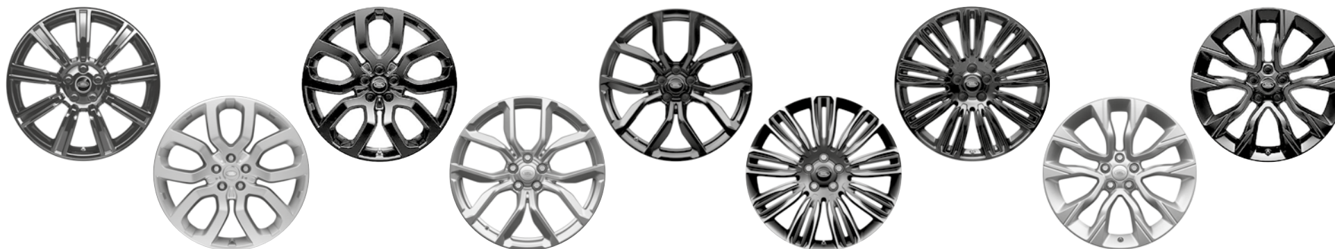
21" KOLA S 9 PAPRSKY GLOSS BLACK (STYLE 9001) 2