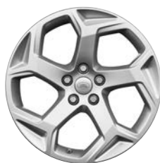
20" KOLA S 5 DVOJITÝMI PAPRSKY (STYLE 5084) 1