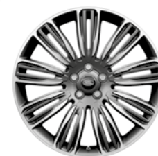
22" KOLA S 9 DVOJITÝMI PAPRSKY DARK GREY DIAMOND TURNED (STYLE 9012) 3