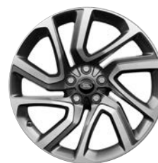
21" KOLA 5 DVOJITÝMI PAPRSKY DIAMOND TURNED (STYLE 5085)