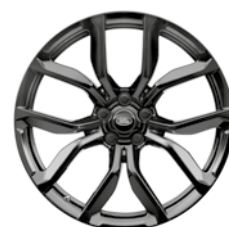
22" KOLA S 5 DVOJITÝMI PAPRSKY GLOSS BLACK (STYLE 5083) 4