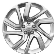
21" KOLA S 5 DVOJITÝMI PAPRSKY (STYLE 5085)