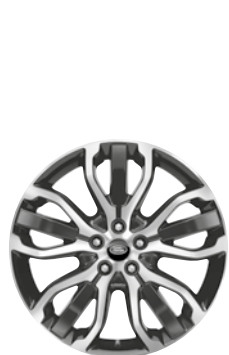
21" KOLA S 5 TROJITÝMI PAPRSKY GLOSS BLACK DIAMOND TURNED (STYLE 5007)