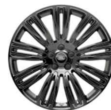
22" KOLA S 9 DVOJITÝMI PAPRSKY GLOSS BLACK (STYLE 9012) 2,3