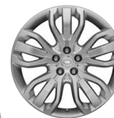
21" KOLA S 5 TROJITÝMI PAPRSKY (STYLE 5007)