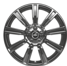
21" KOLA S 9 PAPRSKY GLOSS BLACK (STYLE 9001) 2