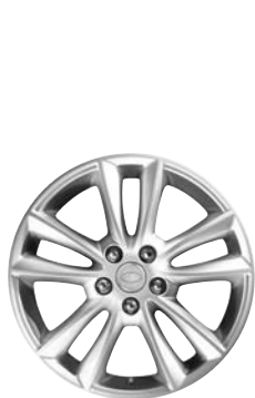
19" KOLA S 5 DVOJITÝMI PAPRSKY (STYLE 5001) 3