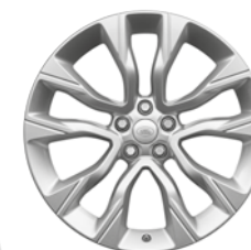
22" KOLA S 5 DVOJITÝMI PAPRSKY (STYLE 5086) 3