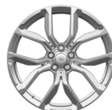
22" KOLA S 5 DVOJITÝMI PAPRSKY SATIN POLISHED (STYLE 5083) 4