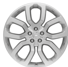
22" KOLA S 5 DVOJITÝMI PAPRSKY (STYLE 5004) 3