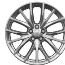
21" KOLA 5 TROJITÝMI PAPRSKY SATIN POLISHED (STYLE 5091)