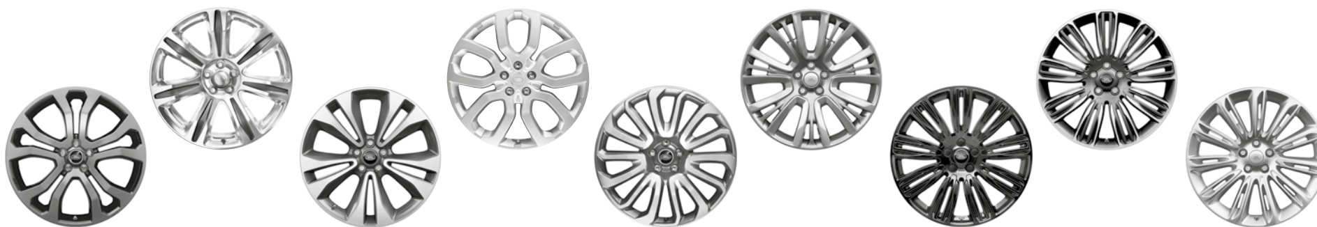
21" KOLA S 5 DVOJITÝMI PAPRSKY DARK GREY (STYLE 5005)