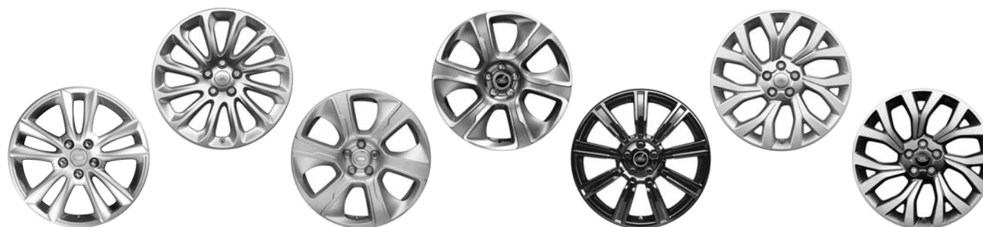
19" KOLA S 5 DVOJITÝMI PAPRSKY (STYLE 5001) 1