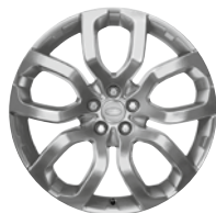
20" KOLA Z LEHKÉ SLITINY S 5 DVOJITÝMI PAPSKY SHADOW CHROME STYLE 504