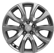
18" KOLA Z LEHKÉ SLITINY S 5 DVOJITÝMI PAPRSKY STYLE 506