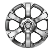
20" KOLA Z LEHKÉ SLITINY SE 6 PAPSKY VIBRATION POLISHED STYLE 601