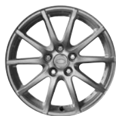
17" KOLA Z LEHKÉ SLITINY S 10 PAPRSKY STYLE 105