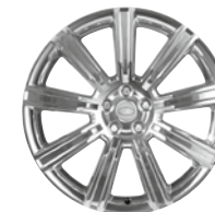
20" KOLA Z LEHKÉ SLITINY S 9 PAPSKY POLISHED SILVER STYLE 901