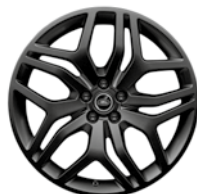
20" KOLA Z LEHKÉ SLITINY S 5 DVOJITÝMI PAPSKY SATIN BLACK STYLE 508