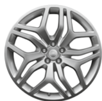
20" KOLA Z LEHKÉ SLITINY S 5 DVOJITÝMI PAPSKY SILVER STYLE 508