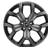
20" KOLA Z LEHKÉ SLITINY S 5 DVOJITÝMI PAPSKY SATIN TECHNICAL GREY STYLE 527