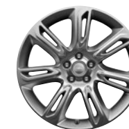
19" KOLA Z LEHKÉ SLITINY SE 7 DVOJITÝMI PAPRSKY STYLE 707