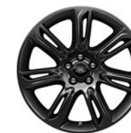
19" KOLA Z LEHKÉ SLITINY SE 7 DVOJITÝMI PAPRSKY GLOSS DARK GREY STYLE 707