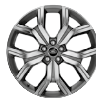
20" KOLA Z LEHKÉ SLITINY S 5 DVOJITÝMI PAPSKY CONTRAST DIAMOND TURNED STYLE 527