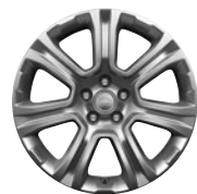
18" KOLA Z LEHKÉ SLITINY SE 7 PAPRSKY STYLE 706