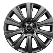
19" KOLA Z LEHKÉ SLITINY S 10 PAPRSKY STYLE 103