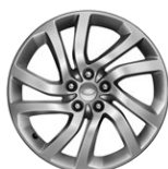
20" KOLA Z LEHKÉ SLITINY S 5 DVOJITÝMI PAPRSKY, STYLE 5011