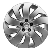
20" KOLA Z LEHKÉ SLITINY S 10 PAPRSKY, STYLE 1035