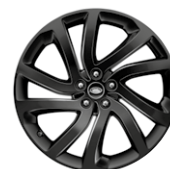
22" KOLA Z LEHKÉ SLITINY S 5 DVOJITÝMI PAPRSKY, GLOSS BLACK STYLE 5011