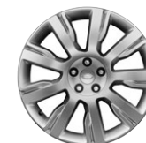
21" KOLA Z LEHKÉ SLITINY S 9 PAPRSKY, STYLE 9002