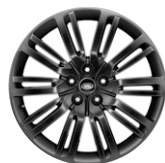
21" KOLA Z LEHKÉ SLITINY S 10 DVOJITÝMI PAPRSKY, GLOSS BLACK STYLE 1012