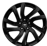
20" KOLA Z LEHKÉ SLITINY S 5 DVOJITÝMI PAPRSKY, GLOSS BLACK STYLE 5011