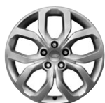
19" KOLA Z LEHKÉ SLITINY S 5 DVOJITÝMI PAPRSKY, STYLE 5021