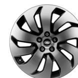
20" KOLA Z LEHKÉ SLITINY S 10 PAPRSKY, DIAMOND TURNED STYLE 1035