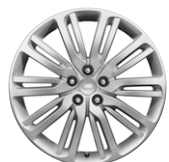
21" KOLA Z LEHKÉ SLITINY S 10 DVOJITÝMI PAPRSKY, STYLE 1012