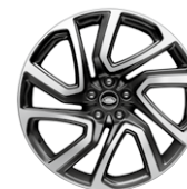
22" KOLA Z LEHKÉ SLITINY S 5 DVOJITÝMI PAPRSKY, SATIN DARK GREY DIAMOND TURNED STYLE 5025