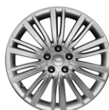
20" KOLA Z LEHKÉ SLITINY S 10 DVOJITÝMI PAPRSKY, STYLE 1011