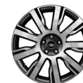
21" KOLA Z LEHKÉ SLITINY S 9 PAPRSKY, DIAMOND TURNED STYLE 9002