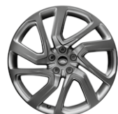
21" KOLA Z LEHKÉ SLITINY S 5 DVOJITÝMI PAPRSKY, SATIN DARK GREY STYLE 5025